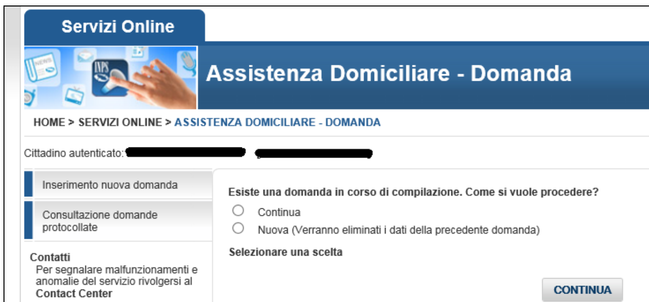
Figura 3: Domanda in corso di compilazione